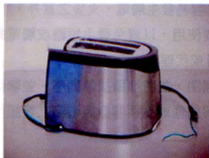
烤麵包器（2個麵包槽）

市面上販售之烤麵包器，結構上，麵包槽有寬、窄麵包槽，一機有2個麵包槽或4個麵包槽；功能上，調熱裝置有分段、無段調整或另外附加解凍、延長加熱、單面烘烤等功能，消費者可依自己需求，挑選適合的烤麵包器。