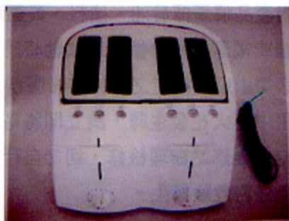
烤麵包器（4個麵包槽）