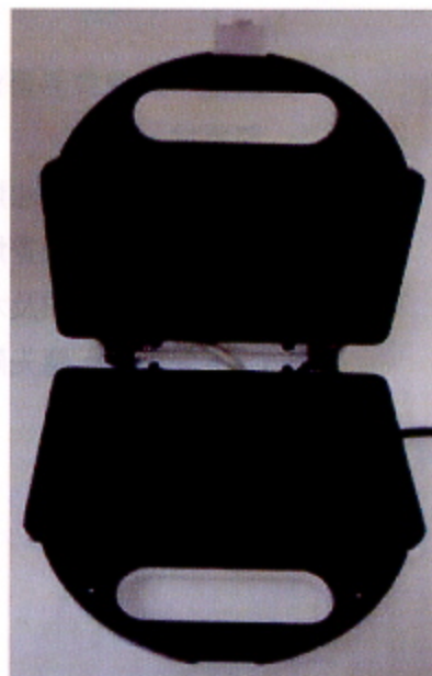
圖二 電熱夾式烤盤