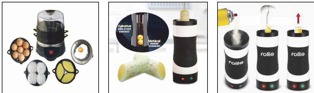
(a)傳統食物加熱器(煮蛋器) (b)杯形煮蛋器及蛋棒點心 (c)杯形煮蛋器的使用方式 圖 1 杯形煮蛋器外觀及使用方式

筆者曾介紹一種「食物加熱器」，可用來蒸炊小量的甜點、饅頭、包子、麵食、餃子、粽子等，尤其提供蛋架供快速蒸煮蛋類，故也稱為「煮蛋器」。不過目前市面出現一種特殊杯形煮蛋器，其只能煎煮，無法蒸炊，無需加水，僅採用溫控開關防止異常溫升，使用時對杯體內部噴灑少許食用油防止沾鍋，再打顆蛋下去就可以了，煎熟後會產生一膨脹像泡棉般蛋棒，接著不沾鍋會自動彈出，插上竹籤即可食用，由於口感膨鬆因此很受家中小孩歡迎。此類產品是近幾年由美國家電公司「Kalorik」開發出的，又名「Rollie Eggmaster」，該商品除蛋棒製作外，也能製作出披薩捲筒和肉桂捲等料理，目前國內廠商已能生產，其單價在 1000 元左右，本文介紹這種特殊煮蛋器的商品知識供消費者認識。