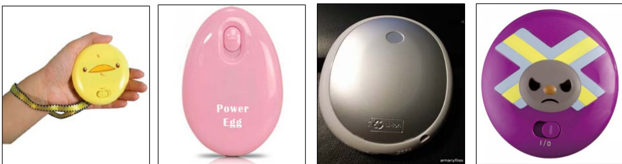
a. 一般電池 3V 3W b. 可重複充電鋰電池 c. 可重複充電鋰電池 d. 可重複充電鋰電池

在 199 期檢驗雜誌「電暖餅選購與使用指南」一文中曾簡略提過一種入冬後，攜帶方便隨時隨地能溫暖雙手與胸口的電暖蛋個人保暖電器，本文就是要詳細介紹這個商品。說起電暖蛋的發明，不得不從 10 年前出現的暖暖包及 扳折式暖暖包說起，「暖暖包」每個單價只要 10 元採拋棄式，主要由鐵粉、水、活性炭、蛭石與食鹽等材料製成粉末，呈現粉末狀是為了增加與空氣接觸的面積來加速反應，蛭石和活性炭作為吸附劑，能夠吸附空氣中的氧氣、水氣與鐵粉進行氧化放熱，而食鹽在反應的過程中扮演催化劑角色，其溫度可達 50°C~65°C。但其缺點是弄破後流出之流質會傷害皮膚。拋棄式暖暖包雖然便宜，但放熱完的鐵粉相當於一團難以再次利用的鐵鏽，必須以不可燃廢棄物處理，其實是無形中耗費許多資源的保暖方法。在暖暖包熱賣 1,2 年後，市場隨即推出可重複使用之「扳折式暖暖包」，它是以醋酸鈉過飽和溶液和金屬片做為內容物，因飽和溶液的不穩定性，扳動金屬片微弱震動能量就足以讓醋酸鈉溶質以結晶析出並釋放熱量，只要將暖暖包再加熱，醋酸鈉結晶溶解並冷卻即回至過飽和溶液狀態，即可重複使用，其價位約 100 元，每次發熱可維持 2 小時，但結晶的暖暖包以 100°C 煮沸再冷卻往往需 10 分鐘以上才能還原，使用上受到限制，才在 5 年後出現了電暖蛋的進化商品。電暖蛋於 2010 年由日本三洋公司開發行銷全球，2011 年各家廠商開始模仿生產，因使用 3 號電池當電源，並以電熱膜、陶瓷 PTC、電熱絲等作材料作為發熱體，體積可縮小至手掌般大，加上攜帶方便與購買電池方便等優點而大受歡迎，隨後電路也發展至可接受重複充電使用之鋰電池，使電暖蛋供熱時間可延長至 2 小時，比一般鎳鎘電池或鹼性電池整整多了一個小時，更沒有舊式暖暖包的環保與 扳折式暖暖包的復原 等候問題，正式成為暖手及懷爐最佳代名詞。故其選購與使用指南值得介紹，圖 1 顯示電暖蛋外觀樣式及機型。