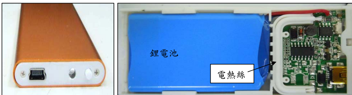
圖 2 採用鋰電池的懷爐；具充電電路；發熱體:電熱絲 (購自樣品拆解)

電暖蛋有些設計有高溫、中溫、低溫等控溫電路，但大部份都是電源ON/OFF功能，電熱發熱體有採用電熱絲、電熱膜、陶瓷等材料者，但以電熱膜居多，圖2~圖4顯示電暖蛋各種機型之內部結構。電暖蛋大部份採電池電源，電池可以是鎳鎘電池、鹼性電池、鋰電池等，其中鹼性電池及鋰電池者因可重複充電使用，故電暖蛋若採用鹼性電池及鋰電池，內部通常設計有充電電路，導致外殼上會留有充電孔；也有電暖蛋是不用電池供電的，這時往往可看到其外殼連接一條USB電源線，必需插在電腦USB孔或使用插牆式USB整流器插孔才能使用，這也代表消費者行動將受到限制。電暖蛋電壓規格都為直流DC 3 V ~ 4 V間，消耗功率則在2 W ~ 10 W間。