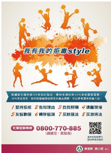
圖 3 拒毒 8 招海報