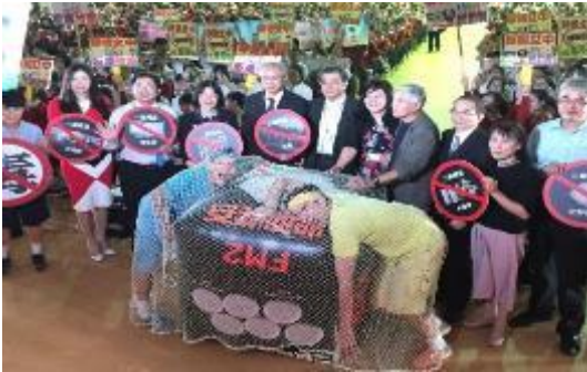
圖 1 拯救浮士德青少年反毒劇