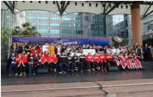
圖 62 全國反毒創意舞蹈大賽全國總決賽活動