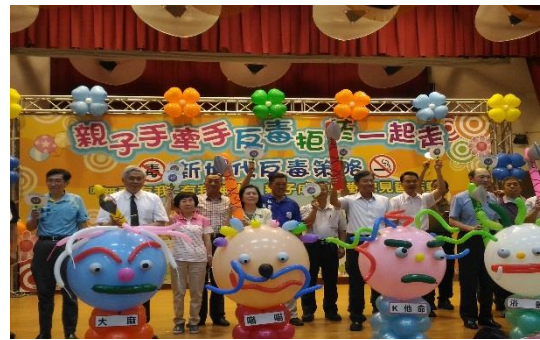
圖 59 親子成長暨觀摩見習(基隆市)