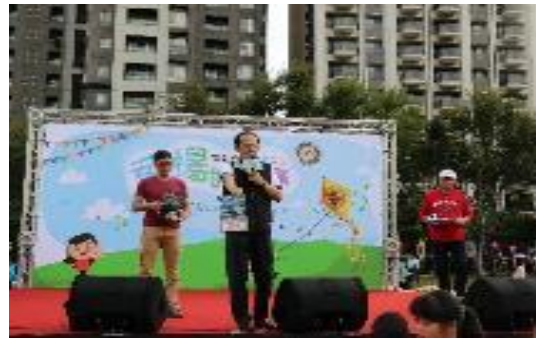
圖 65 結合「以臺中中科技扶輪社為首」辦理飛揚的青春-拒絕毒品、彩色人生