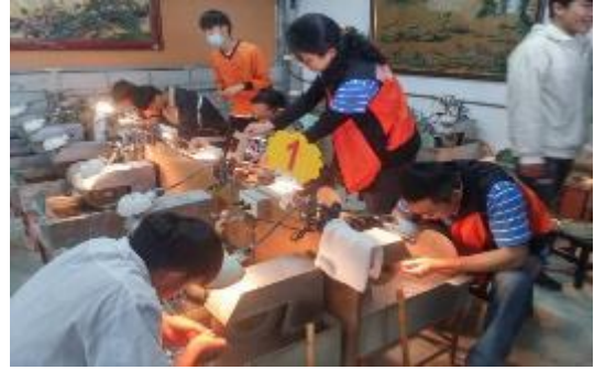
圖 54 花蓮縣諮詢服務團玉石課程