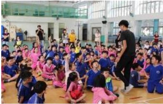
圖 8 文藻外語大學學生至國小進行藥物濫用防制宣導活動