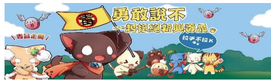
圖 4 公車廣告-FB