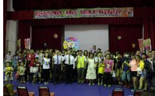
圖51無毒有我我無毒反毒教育親子營