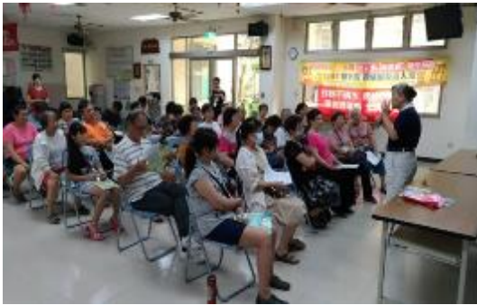
圖 58 前進社區反毒宣講