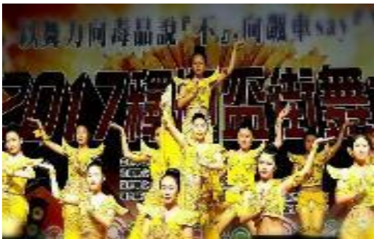
圖 64 結合「釋迦功德會」辦理反毒反飆車舞蹈大賽