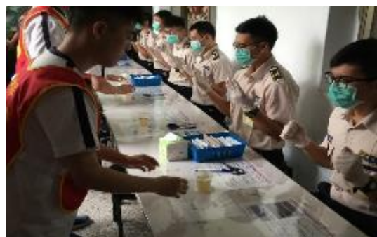
圖 55 替代役男入營尿液篩檢

替代役役男入營人數 106 年計 2 萬 8,392 人，安排藥物濫用防制宣導課程，達到初級預防目的，並全面實施尿液篩檢，特定人員予以造冊列管，轉介至全國 8 所藥癮戒治醫院諮商 4 次，以團體、個別諮商方式，提供心理復健與藥癮戒治等協助，106 年共轉介諮商 113 案次，並請各替代役服勤單位針對藥物濫用列管役男每 1 至 2 個月實施不定