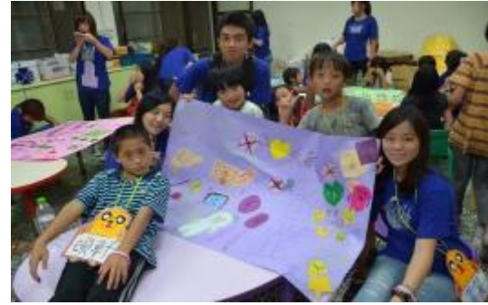
圖 9 中原大學至國小進行藥物濫用防制宣導活動