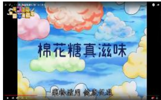
圖 43 反毒動畫-棉花糖真滋味