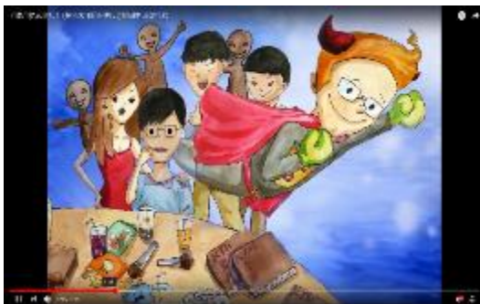
圖 42 桃園市國中學生自製反毒動畫