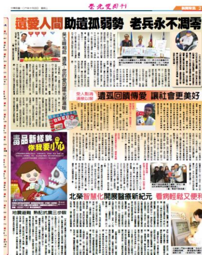
圖 14 榮光雙周刊登載反毒文宣