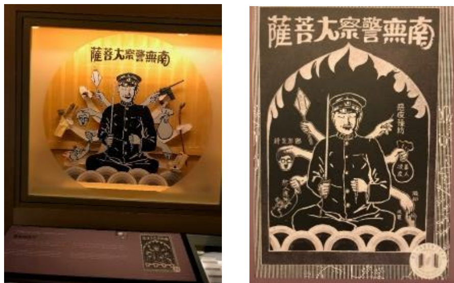
圖 10 「斯土斯民：臺灣的故事」常設展「鉅變與新秩序」