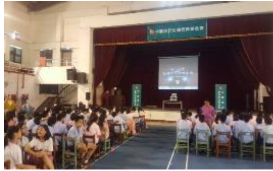
圖 41 「趕路的雁全人關懷協會」3D 移動式電影車反毒宣導活