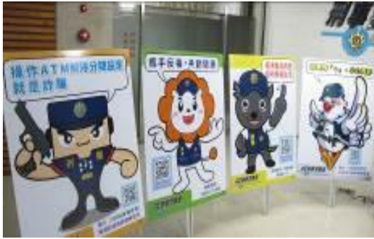
圖 25 犯罪預防吉祥物徵件