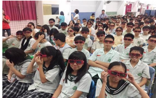
圖 63 本市學生校園 3D 反毒電影體驗