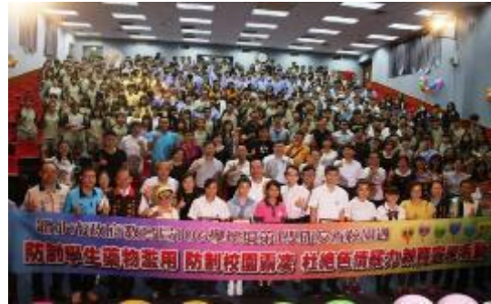
圖 47 朱市長主持「友善校園 - 響應毒品零容忍」宣示活動