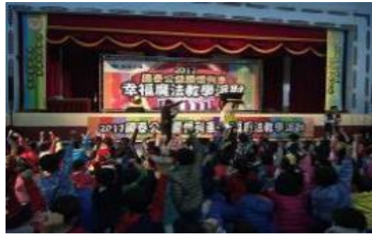
圖 29 幸福魔法教學派對