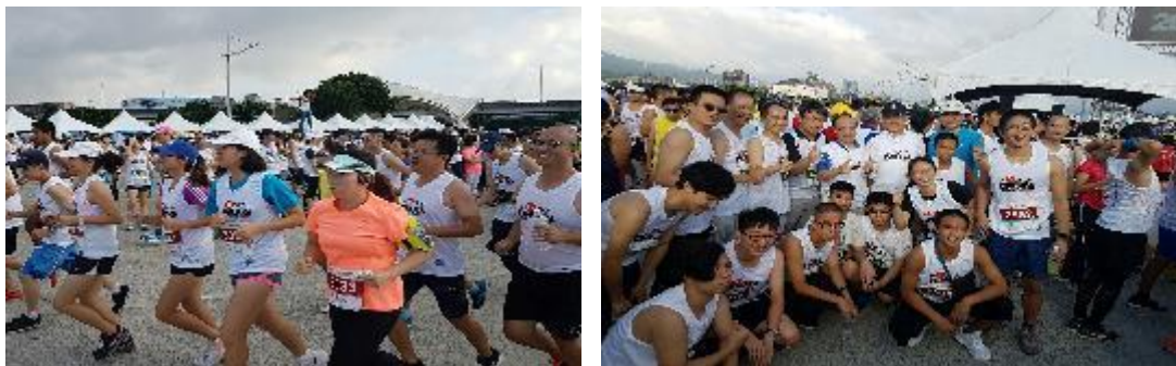
圖 52 臺北市政府與國際扶輪社合辦反毒路跑活動