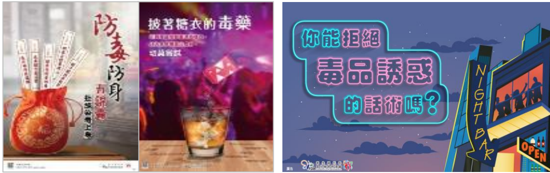
圖 32 拒毒宣導海報及懶人包