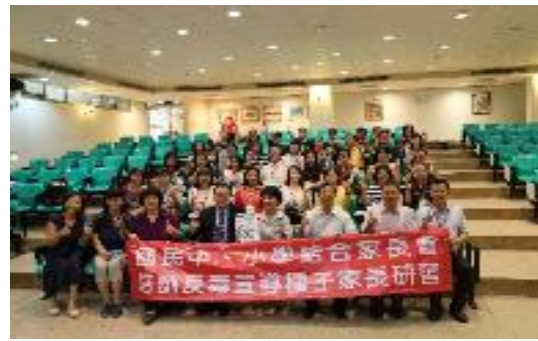
圖 49 結合家長會培訓反毒宣導種子家長入班宣導