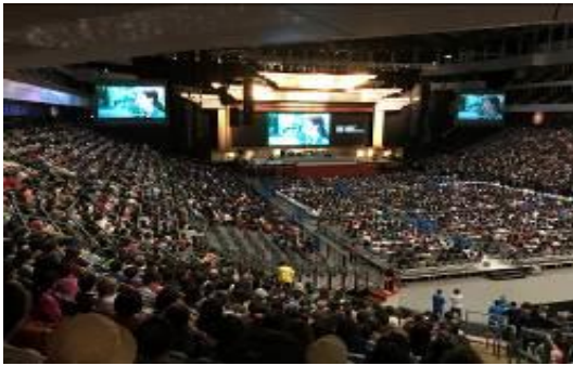
圖 23 「勇敢的心」反毒電影撥放