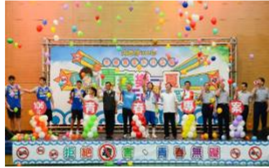
圖 24 青春專案起跑暨校園反毒宣導活動