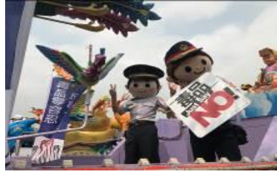
圖 22 反毒花車