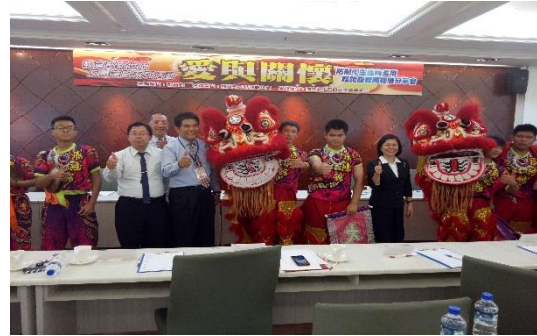
圖 11 愛與關懷經驗分享會