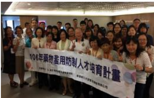
圖 35 藥物濫用防制人才培育課程 (北區)