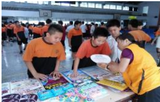
圖 46 春暉志工於新泰國小實施反毒設攤宣導

持續辦理各級學校「加強教育人員反毒知能研習」、「防制學生藥物濫用校園宣講」、「運用班會時間收視反毒動畫或微電影及春暉認輔志工入校設攤實施反毒宣導等活動，106 年度迄今辦理各類研習及宣導活動計 483 餘場次，約 14 萬餘人次參加。(圖 46、47)