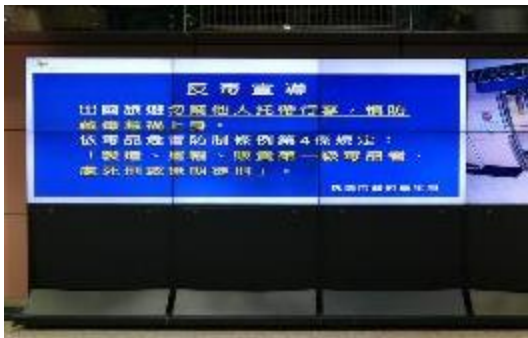
圖 38 桃園機場電子顯示器刊登反毒宣導