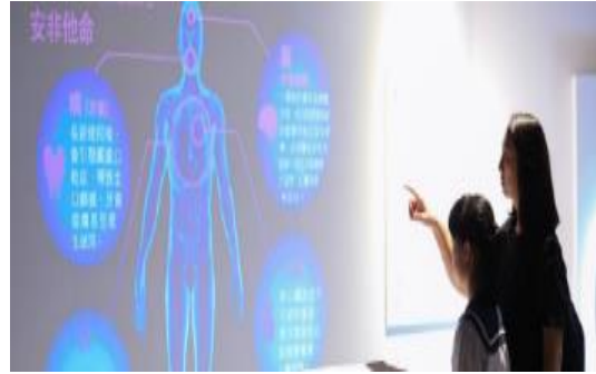
圖 2 「識毒-揭開毒品上癮的真相」反毒特展