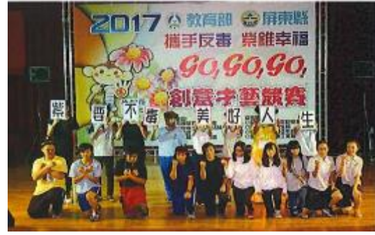
圖 7 屏東縣反毒創意才藝競賽