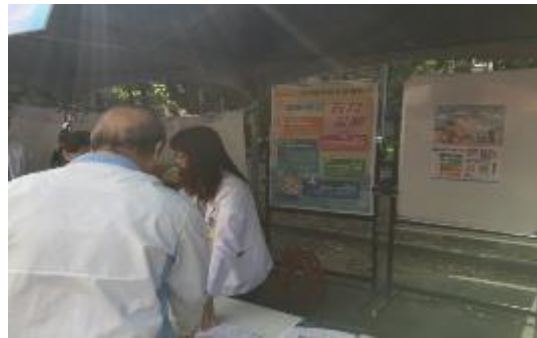
圖 15 高榮臺南分院院慶園遊會設置「毒品遠離我」反毒宣導攤位