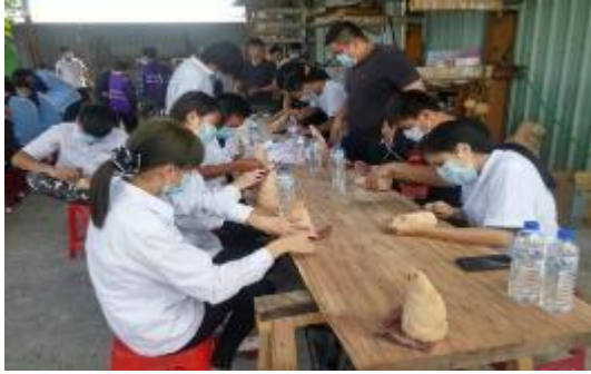
圖 53 花蓮縣諮詢服務團木雕課程