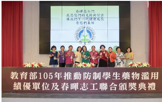
圖 10 105 年績優春暉認輔志工表揚