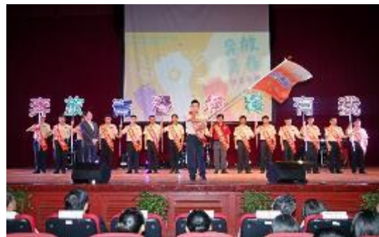
圖 21 替代役公益大使團