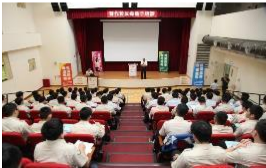
圖 20 替代役反毒種子培訓