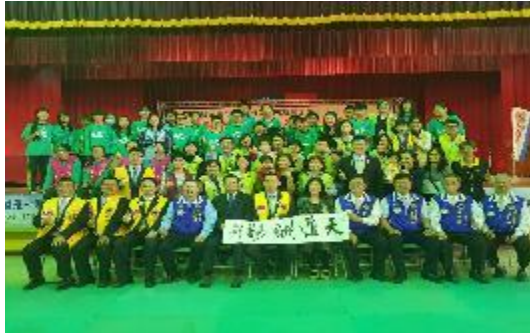
圖50「南瀛獅子盃第六屆反毒書法比賽」