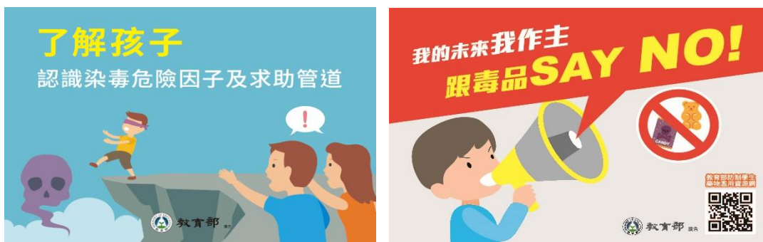
圖 12 家長懶人包及學生懶人包