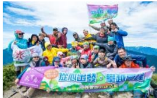
圖 57 防制學生藥物濫用諮詢服務團戶外冒險訓練活動