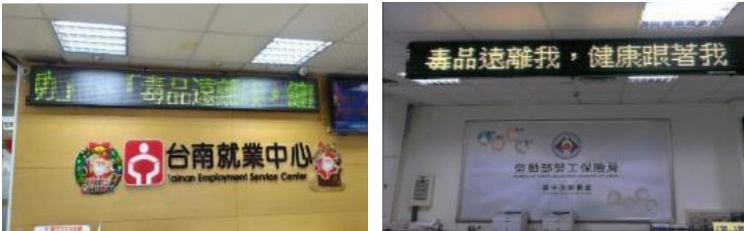
圖 19 勞動力發展署及勞工保險局運用跑馬燈進行反毒宣導