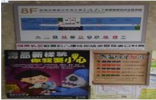
圖 16 職業安全衛生署辦公廳舍張貼反毒宣導海報