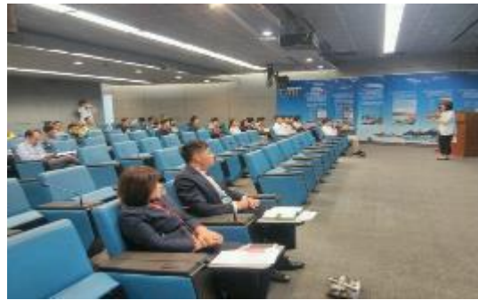
圖 39 藥師主講酒精及新興毒品之危害，提升同仁反毒認知