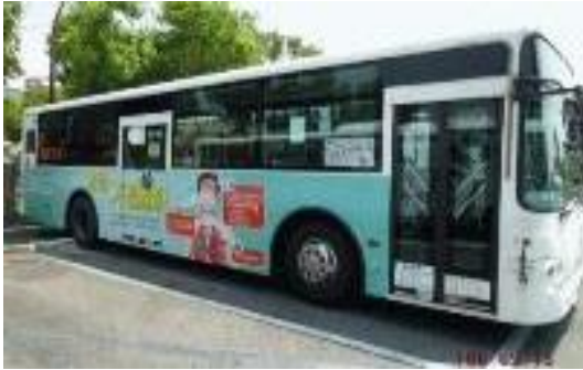
圖 33 「青春 不惹麻煩」公車車體宣導

(7) 106 年共結合 25 個民間團體，以寓教於樂方式，包括相聲、舞蹈、話劇、授課、大型活動等，吸引青少年及民眾參與，藉此強化民眾拒毒意念與認知；總計辦理 1,566 場次宣導活動，受益人次約 27 萬 0,304 人次。(圖 36)