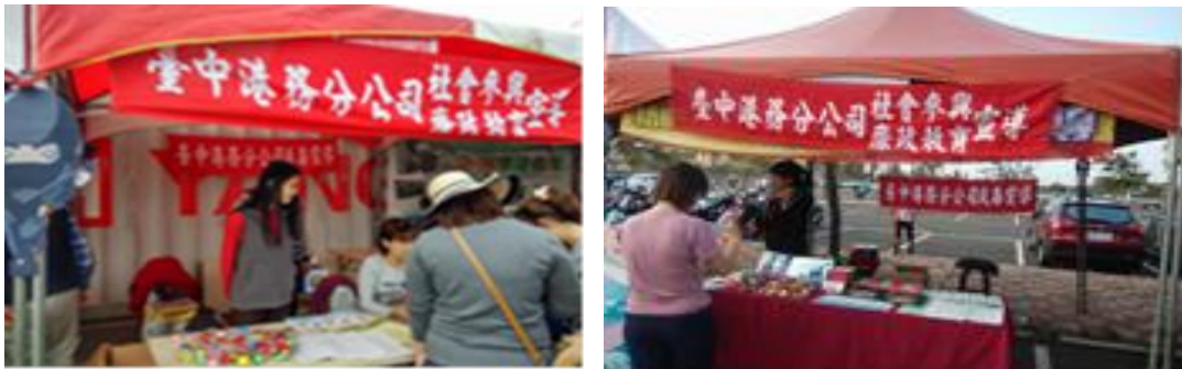
圖37「微笑港灣反菸拒檳毒-安全健康齊步」健康安全週活動