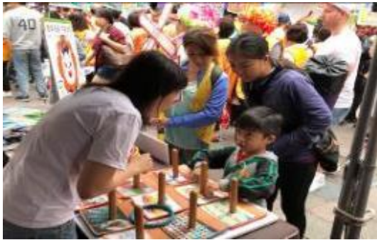
圖 28 反毒反酒駕熱舞、百年快樂 服務獅友總動員