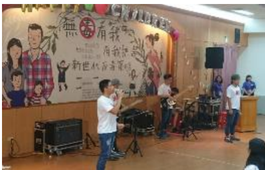
圖 44 桃園無毒有我親子成長營