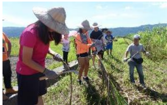
圖 68 中國信託反毒教育基金會體驗式反毒教材暨暑期營隊