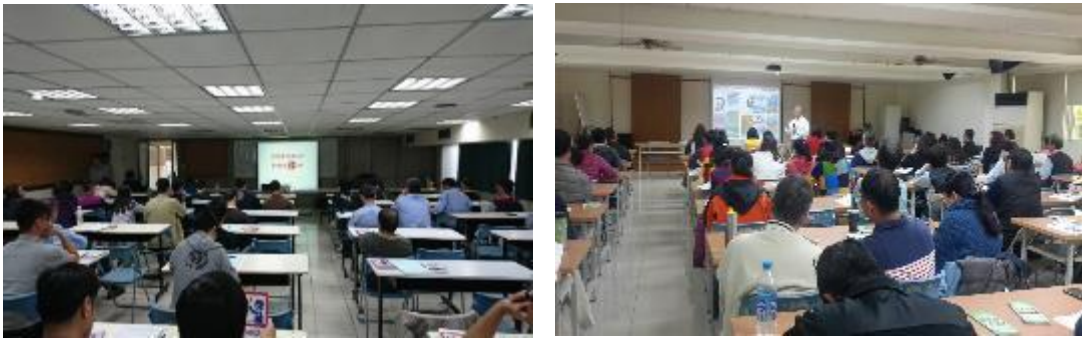
圖 18 職業安全衛生署辦公廳舍張貼反毒宣導海報