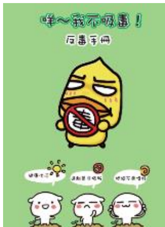
圖 30 「咩~我不吸毒！」 反毒手冊