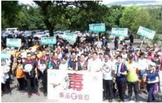
圖 6 花蓮縣反毒路跑大會師

(7) 各縣市高級中等以下學校辦理「防制學生藥物濫用」校園宣教共計 2,015 場次，參加學生約 49.4 萬餘人次。