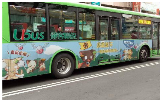
圖 5 公車車體反毒宣導