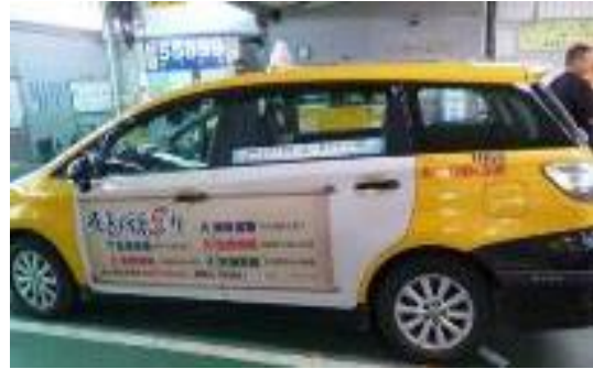
圖 34 反毒防身 5 術」計程車車體宣導