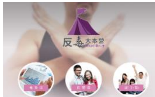
圖 31 「反毒大本營」網站入站畫面