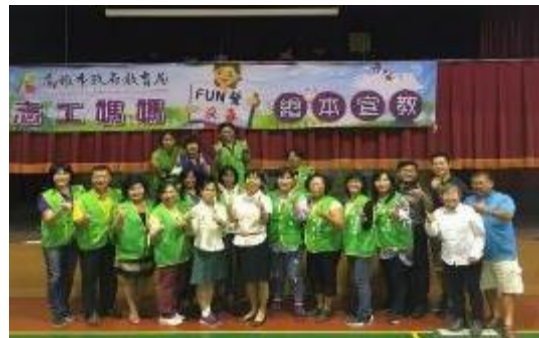
圖 67 培訓說故事媽媽入班宣導