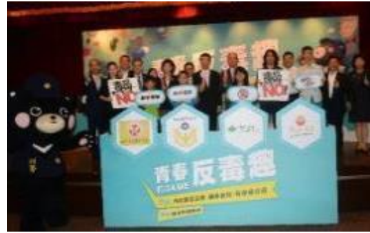
圖 26 青春反毒趣