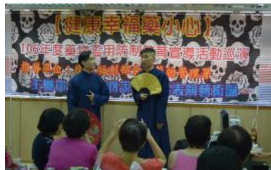
圖 36 笑將說學逗唱相聲表演

(8) 為營造健康無毒職場環境，運用企業熟悉的 P-D-C-A 管理工具，於 36 家企業內部推動藥物濫用防制相關活動，總計 21 場次，4,426 人次參加。