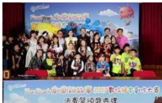
圖 61 「創意說故事」數位繪本競賽 「反毒創作組」