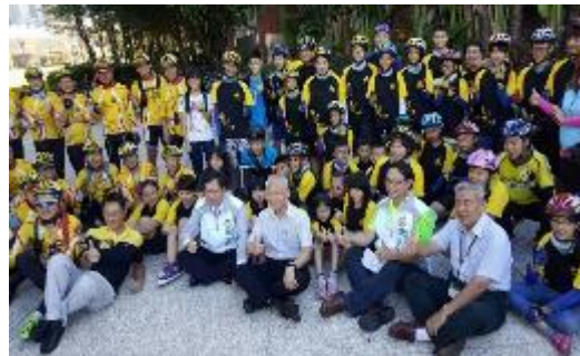
圖 56 桃園市長為高關懷學生自行車環島打氣鼓勵