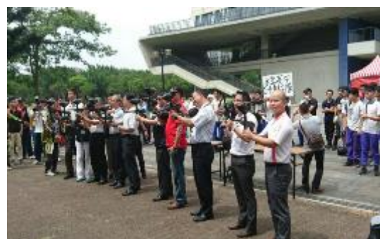
圖 45 桃園市打擊毒品漆彈競賽