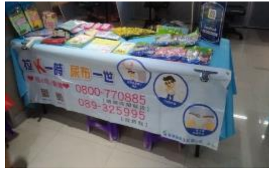
圖 17 勞動力發展署高屏澎東分署辦理徵才活動