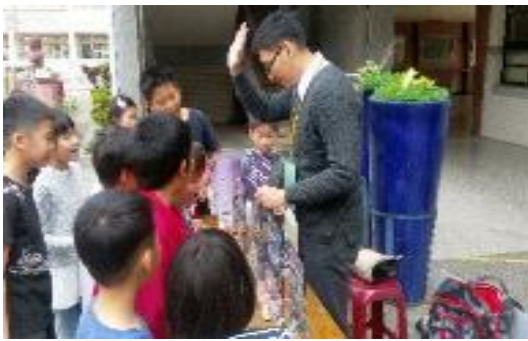
圖 48 校園仿真毒品巡迴列車