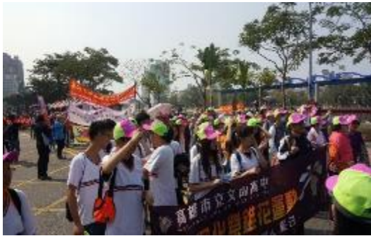
圖 66 獅出有愛 無毒有我公益健走，全民響應反毒活動