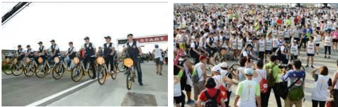
圖 27 萬人反毒公益路跑