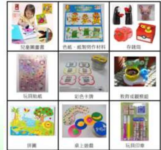
▲9大類低危害風險玩具改採「符合性聲明」。