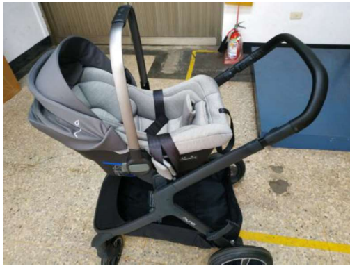
手推嬰幼兒車搭配汽車 安全座椅