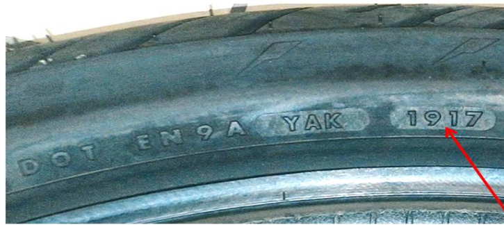
圖 1 製造日期代碼之標示圖例