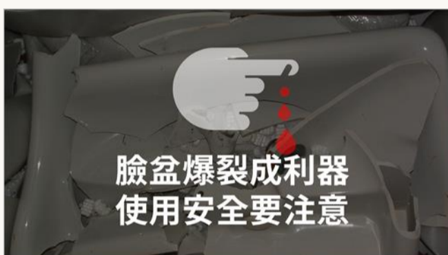
臉盆爆裂成利器 使用安全要注意