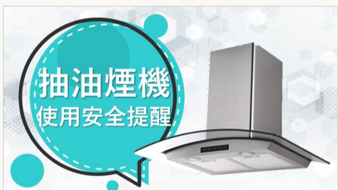
抽油煙機使用安全提醒