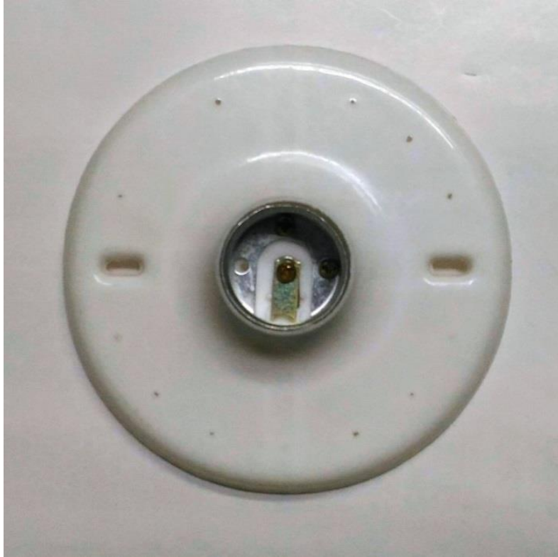
圖 1、具有單一螺旋型燈座(無燈罩)及支撐、固定光源所需零件之燈具商品(市售俗稱為燈座)，為應施檢驗商品